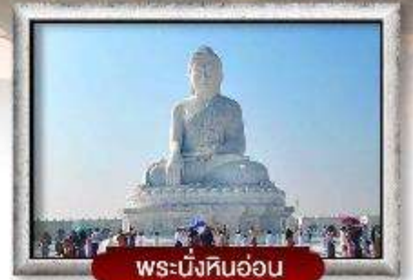
พระนั่งหินอ่อน