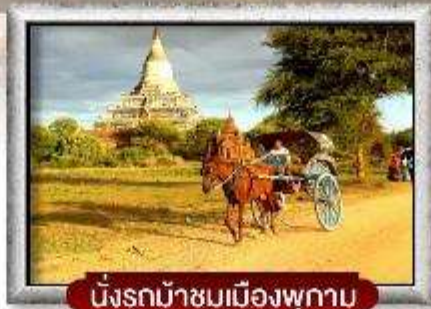
นั่งรถม้าชมเมืองพุกาม